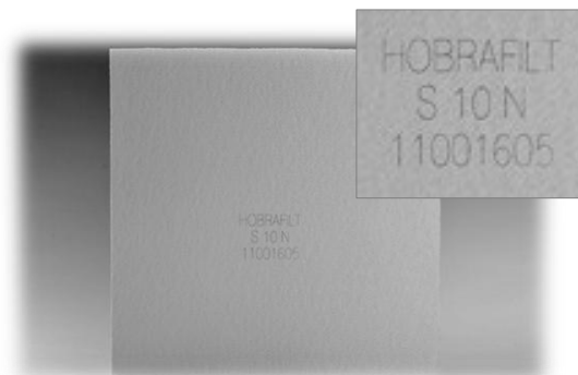
Obr. 2. Výstupní strana filtrační desky